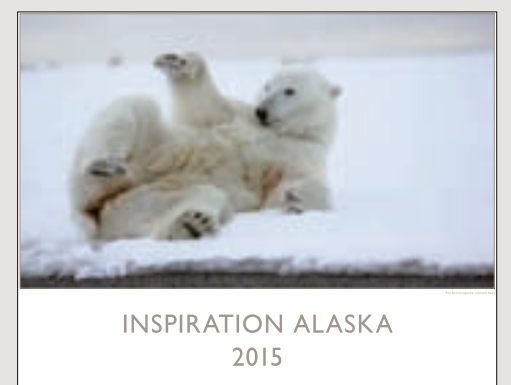
Atemberaubende Eindrücke: „Inspiration Alaska 2015“

Gute Eindrücke von Sebastian Schnülleskanadischer Wahlheimat vermitteln Fotos, die jetzt in einer HTU Kalender Edition erscheinen: „Inspiration Alaska 2015“.