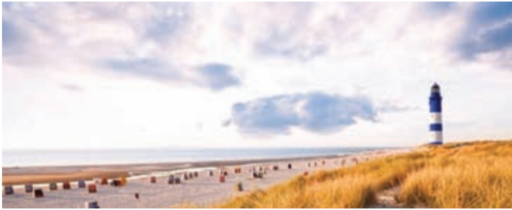
Veränderungen mit Weitblick